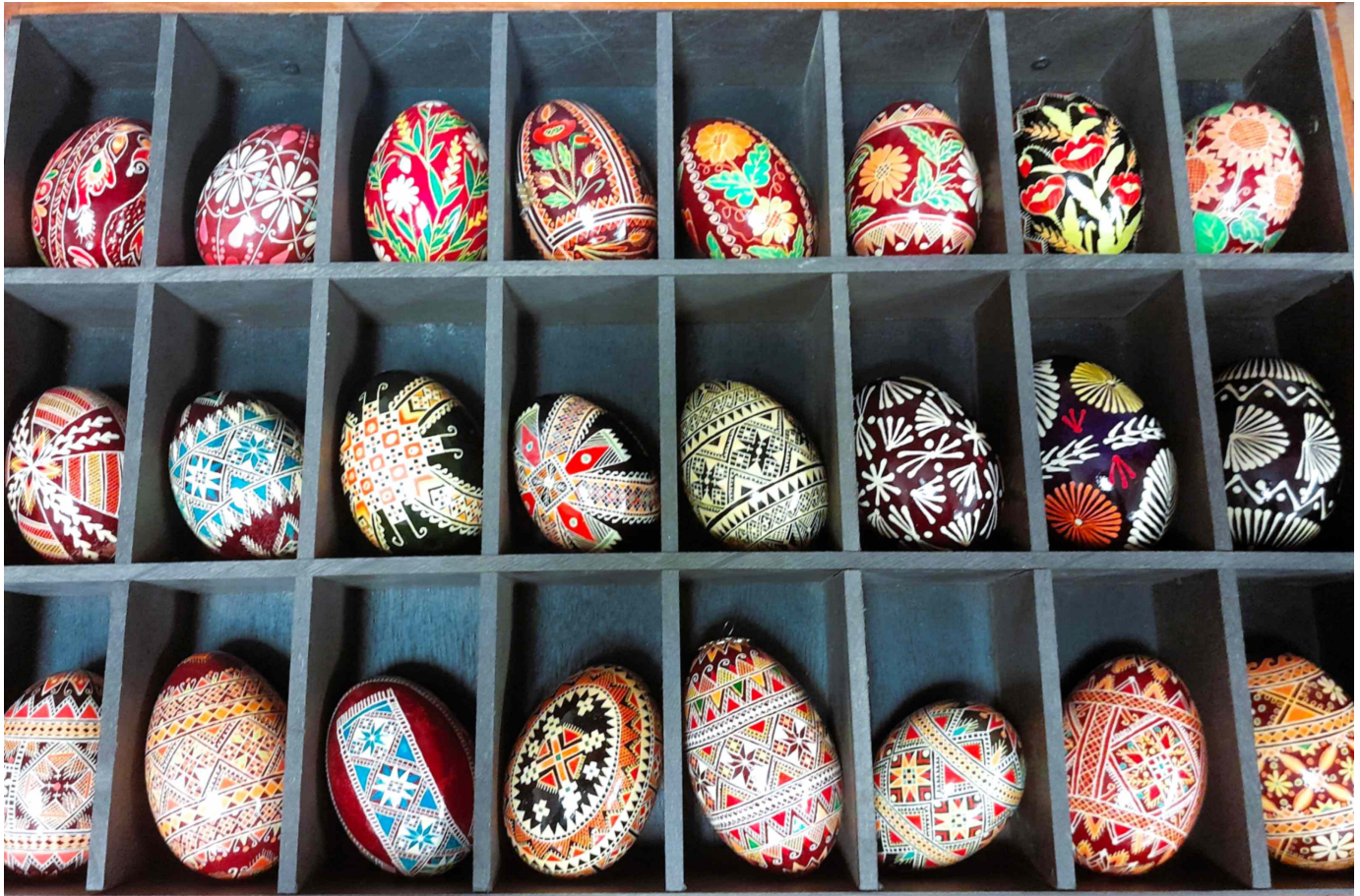
Colección de pysanky ucranianos en la Sala de Legado Basiliana.