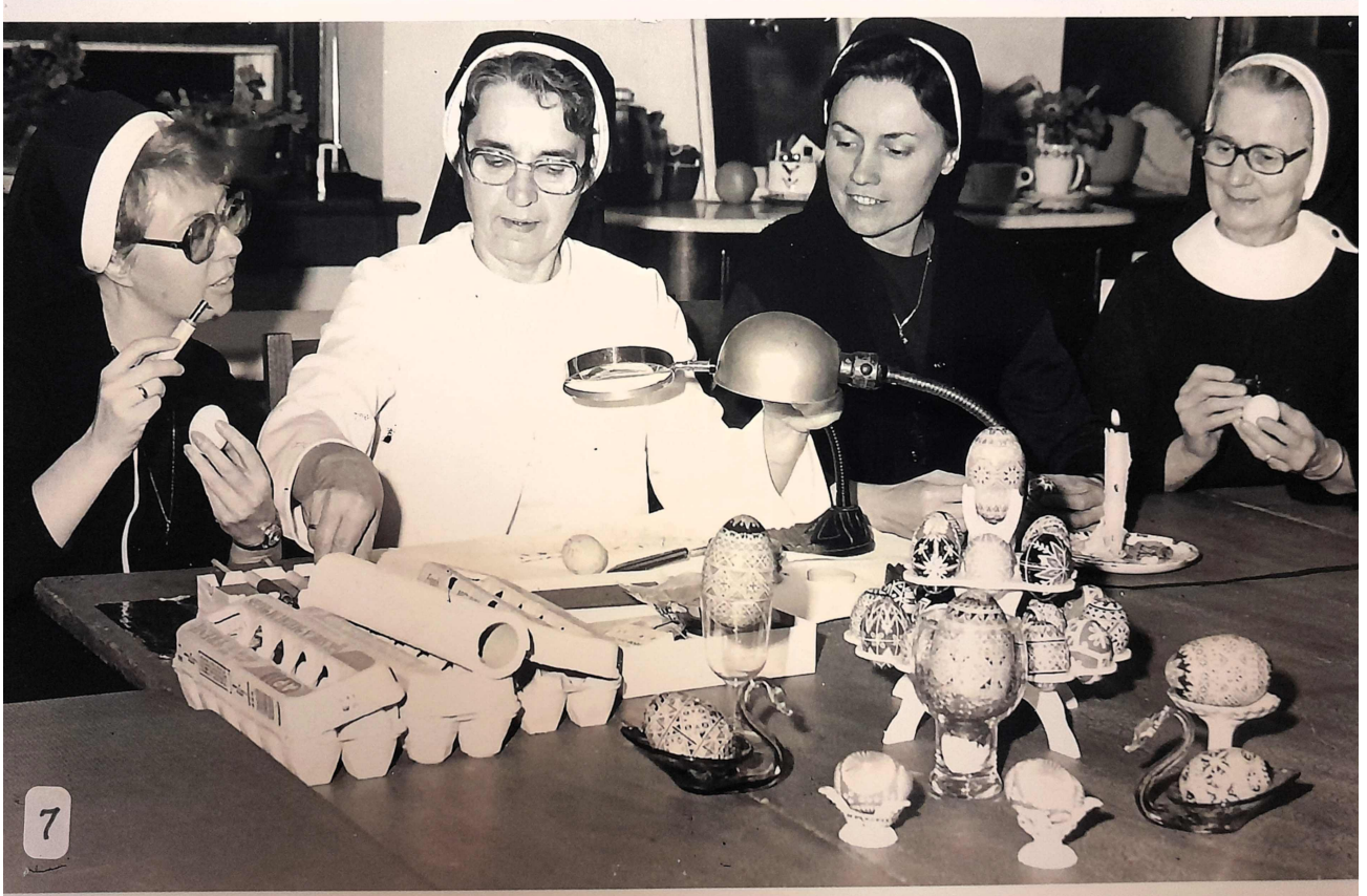
Hermanas decoran huevos al estilo ucraniano.