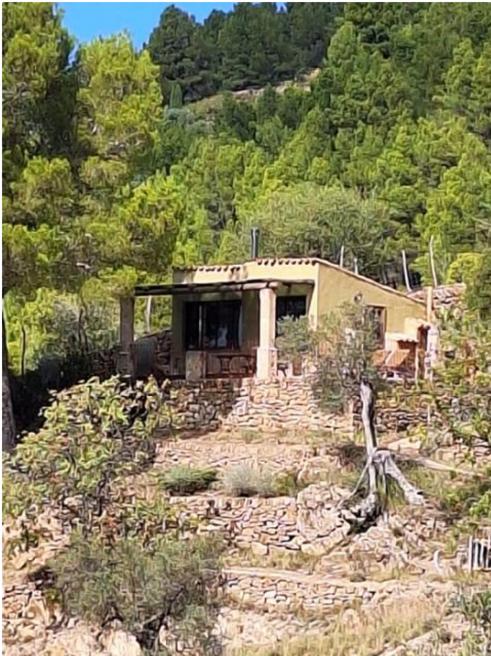
Ermita en Estellencs, Mallorca, España.

Al igual que Jacob, a veces sentimos que estamos peleando con alguien. ¿Un ángel de Dios?, ¿Dios mismo? Pelear en la noche cuando no se puede identificar al agresor, en medio de un profundo silencio, puede ser aterrador, pero Jacob no se rinde hasta que le hace hablar.