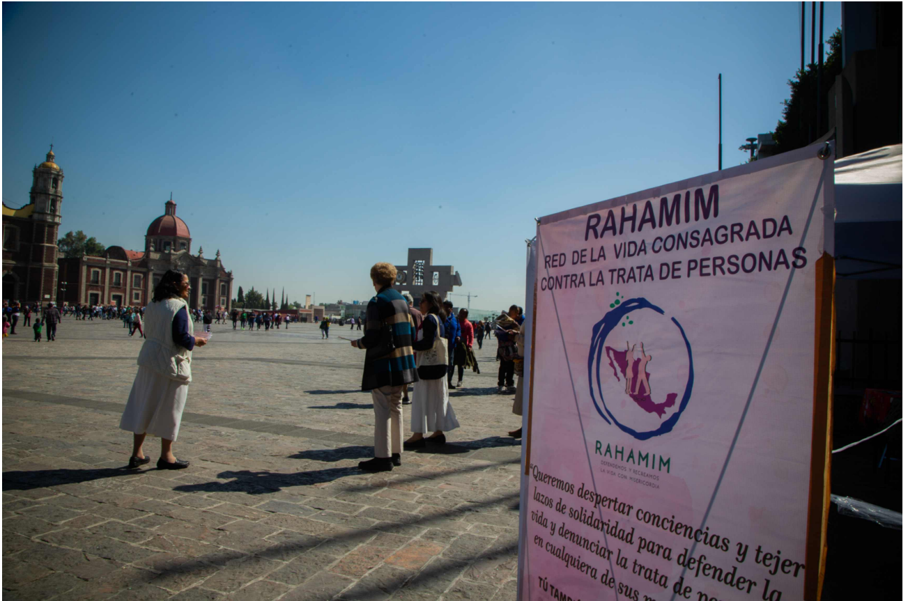
La red Rahamim, integrada por varias congregaciones religiosas mexicanas que trabajan contra la trata de personas a través de México, forma parte de Talitha Kum, la red internacional de la vida consagrada que enfrenta este flagelo.