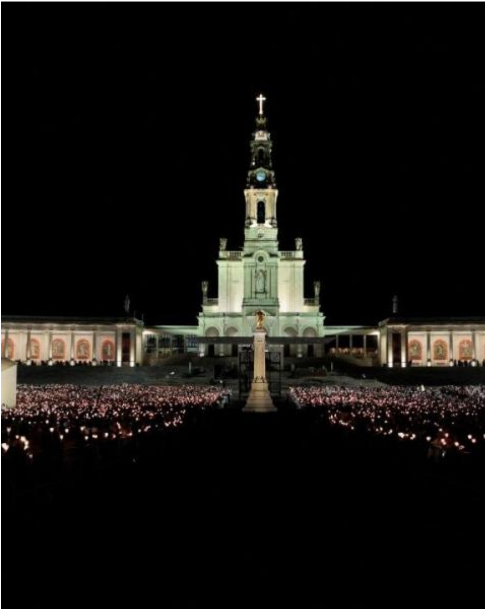
Santuario de Fátima, Portugal, 12 de mayo.